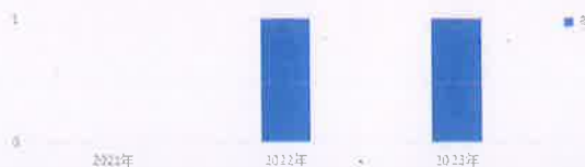
石桥镇2021年—2023年依申请公开统计表

自 2023 年 1 月 1 日起至 2023 年 12 月 31 日止，石桥镇收到政府信息公开申请 1 件（要求申请公开 2005 年至今石楼村村两委经济责任审计报告），全部依法依规予以办理。因依申请公开引发的行政复议案件 0 件，行政诉讼案件 0 件。