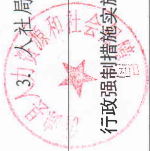
3. 人社局 2019 年度行政强制执行情况统计表